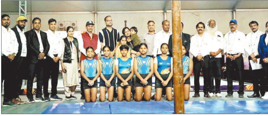
अतिथियों के साथ खिलाड़ी।

बता दें कि खेलो इंडिया ट्राइबल गेम्स 2026 के तहत सरगुजा में भी कुश्ती दंगल और उसके बाद मल्लखंभ प्रतियोगिता का आयोजन किया। राष्ट्रीय स्तर की मल्लखंभ प्रतियोगिता में देश के 14 राज्यों से टीमों शामिल हुई। मल्लखंभ प्रतियोगिता के अंतर्गत विभिन्न स्पर्धाओं का आयोजन किया गया जिसमें बालक एवं बालिका वर्ग में टीम चैंपियनशिप (पोल एवं रोप मल्लखंभ), पिरामिड चैंपियनशिप तथा पुरुष एवं महिला वर्ग में पिरामिड, पोल एवं रोप मल्लखंभ शामिल हैं। टीम स्पर्धाओं में अधिकतम 6 खिलाड़ियों की भागीदारी निर्धारित की गई थी। प्रतियोगिता का शुभारंभ 2 अप्रैल को किया गया। पहले दिन की प्रतियोगिता में छत्तीसगढ़ ने 124.35 अंक के साथ प्रथम, महाराष्ट्र ने 118.35 अंक के साथ द्वितीय व झारखंड ने 86.95 अंकों के साथ तृतीय स्थान हासिल किया था। इसके साथ ही शुक्रवार को प्रतियोगिता का समापन किया गया। प्रतियोगिता में खिलाड़ियों ने रोप मल्लखंभ, पोल मल्लखंभ, हैंगिंग मल्लखंभ, पिरामिड मल्लखंभ में एक से बढ़कर एक करतब दिखाए। खिलाड़ियों के प्रदर्शन पर वहां मौजूद दर्शकों द्वारा तालियां बजाकर उनका उत्साहवर्धन किया गया। प्रतियोगिता के बाद विजेता टीम घोषित किया गया। समापन के दौरान प्रतिस्पर्धा में छत्तीसगढ़ की बालिका टीम उत्कृष्ट प्रदर्शन के साथ विजेता घोषित की गई। विजेता टीमों को शनिवार को आयोजित मेडल सेरेमनी में मेडल प्रदान किया जाएगा।